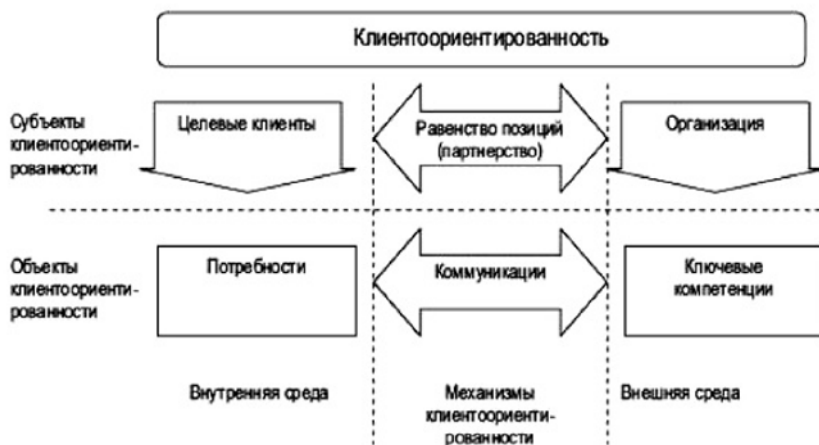
Рис. 1. Взаимосвязь элементов, включаемых в механизм клиентоориентированности

Понимание клиенто-ориентированности компании, основанной на удовлетворении потребностей целевой аудитории, отражено на рисунке 1, в котором описано взаимодействие всех элементов клиенто-ориентированного подхода.