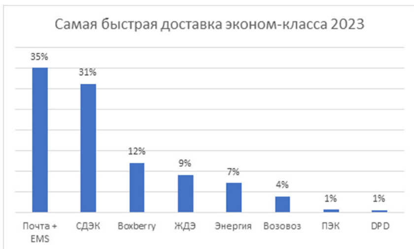
Рис. 2. Самая быстрая доставка эконом-класса