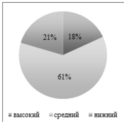
Рис. 1. Уровень выраженности интернет-зависимости

В группе подростков, находящихся в зоне риска относительно интернет-зависимости, были выражены экзальтированность, тревожность, эмотивность.