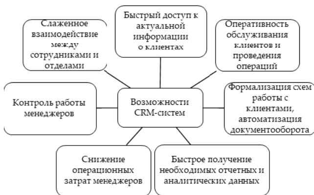
Рис. 2. Возможности CRM систем