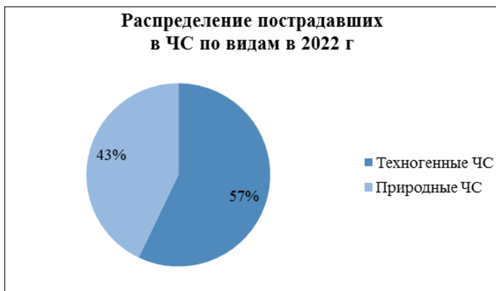
Рис 1. Процентное распределение пострадавших в 2022 г. по видам ЧС

в виртуальное окружение, ощущая себя частью этого мира. «Виртуальная реальность - форма взаимодействия человека с компьютером, создающим синтетические виртуальные среды для погружения в них пользователей» [15].